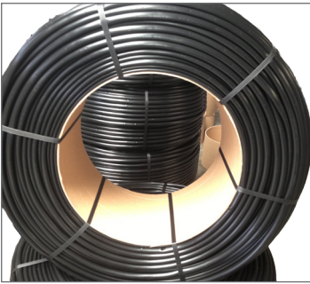
Aries™ 16007 Yuvarlak Boru

İhtiyaçlar doğrultusunda yassı ve yuvarlak modelleri bulunur.